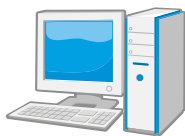
デスクトップ型パソコン