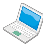
ノート型パソコン